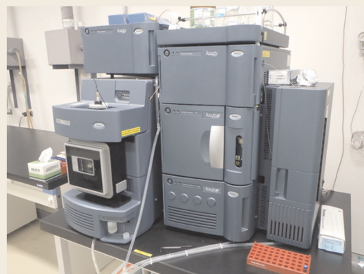
液体クロマトグラフ質量分析計 (有機ヒ素等)

また、硝酸性窒素濃度が高かった場合は、硫酸イオンなどの陰イオン成分やカルシウムイオンなどの陽イオン成分も測定しています。